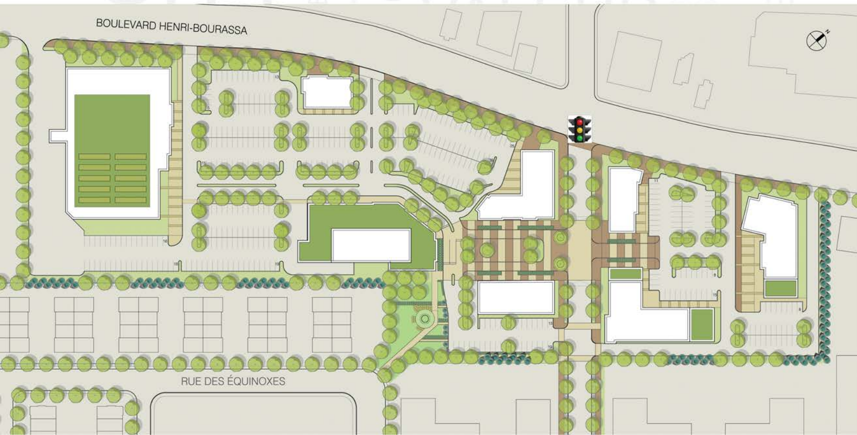
Faubourg Bois-Franc Henri-Bourassa / Marcel-Laurin Montréal (Québec)